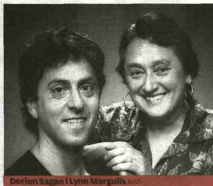
Dorion Sagan i Lynn Margulis AVUI

des de fa segles. Perquè la ciència es mou al tempo de la política i l'economia, i alhora les influencia fortament. En aquesta obra, Dominique Pestre, historiador de la ciència interessat en les implicacions socials de la ciència contemporània, ens parla d'aquestes relacions, des del segle XVI ençà, fent un èmfasi especial en la ciència contemporània. De la tecnociència a les polítiques dels Estats-nació, del liberalisme a les patents, de les noves realitats socials a la societat del risc, i del mercantilisme a les inquietuds socials. Res no escapa a aquesta potent anàlisi d'alta divulgació, que ens farà reflexionar sobre el perquè del pes de la ciència en la societat actual i dels interessos polítics i econòmics per controlar-la.