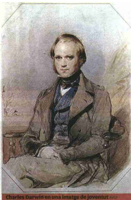
Charles Darwin en una imatge de joventut