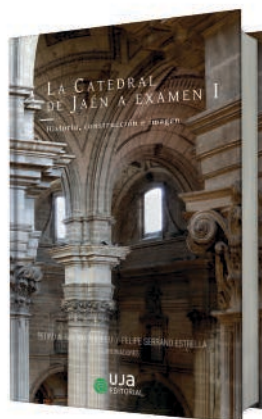
La Catedral de Jaén a examen I Historia, construcción e imagen