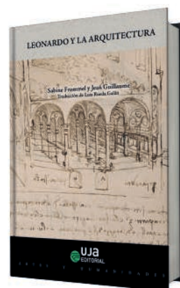
Leonardo y la arquitectura